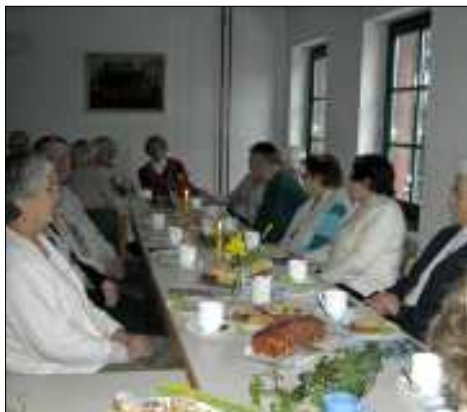
Fröhliche Runde